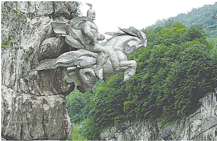
Скульптуру, изображающую Георгия Победоносца, выскакивающего из скалы, называют настоящим рукотворным чудом.

Статуя весом 28 тонн установлена в 1995 г. прямо на скале в начале Алагирского ущелья на высоте 22 метров и создается ощущение, что бронзовое изваяние просто парит в воздухе. Его соорудили на средства городских властей и пожертвования местных жителей.