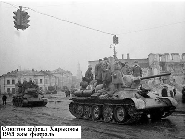
Советон æфсад Харьковы 1943 азы февраль