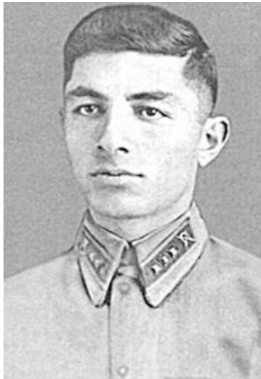
раты 227-æм æхсæг полк".

Горæт Харьков ссæрибар кæныны кадджын революцион хæс æххæст кæнгæйæ, дивизи сæмбæлд знадзы стыр ныхмæлæудыл. Харьковы йæхи бауромынмæ тырнгæйæ, знаг æнувыдæй хъæххæдта горæтмæ бацæуæнтæ. Гитлерон салдæттæ тынг кæмæй æппæлыдысты, уыцы "стыр Германы" полк фылдæр тыхтимæ æртæ хатты рацыд контратакæйы нæ 227-æм фистæг полчы ныхмæ, цæмæй