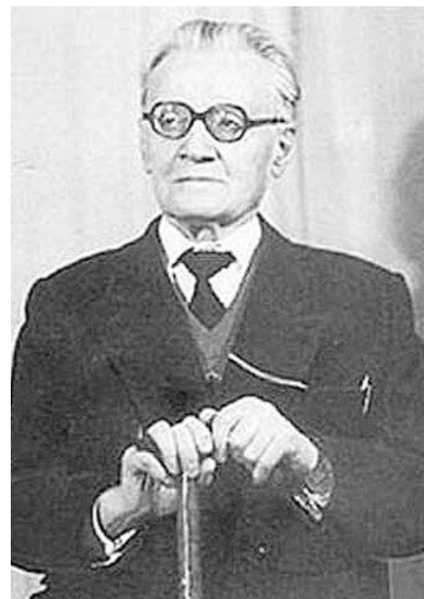
ны кæрты Хетæгкаты Къостайы фарсмæ.

Цардæй ахицæн Мæскуыйы 2001 азы. Иры фæсивæд æй сластой Дзæуджыхъæумæ æмæ йæ кадимæ баныгæдтой Дзæуджыхъæуы Ирон аргъуа-