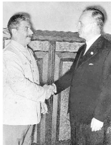
Иоахим фон Риббентроп и Иосиф Сталин при подписании Пакта о ненападении в Кремле. 23 августа 1939 года

Еще в 41-м Гитлер сравнивает Россию с колоссом на глиняных ногах. Но уже на следующий год тон главного нациста меняется. Оказывается, Сталин создал армию, которая до сих пор отказывается признать поражение от вермахта. Более того, Сталин сумел призвать в КА резервистов, а советская экономика обеспечила их вооружением и боевой техникой.