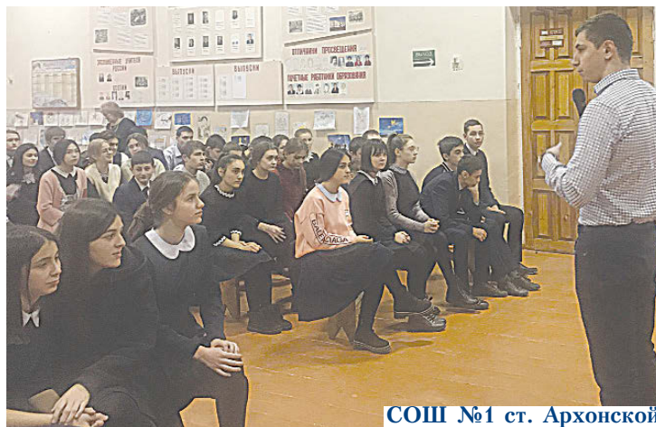
СОШ №1 ст. Архонской

Программа предусматривает 3 этапа: выявление, развитие и удержание бизнес-инициатив. Организаторы проводят выездные презентации программы и мастер-классы в средних образовательных учреждениях, ссузах и вузах республики, учат участников оформлять бизнес-проекты, организуют кейс-чемпионаты, деловые игры и обучающие курсы по основам предпринимательской деятельности.