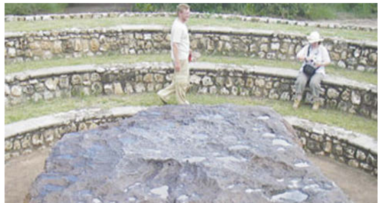
Метеорит Гоба - крупнейший из обнаруженных метеоритов и самый крупный на Земле кусок железа естественного происхождения

Самые большие из упавших на землю железные метеориты были обнаружены в Намибии в 1920 году и в Гренландии в 1817 году.