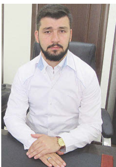
Вакцинация производится бесплатно для граждан на добровольной основе.

Сам в числе первых испытал на себе вакцину и могу заявить, что первый этап вакцинации прошел без побочных эффектов.