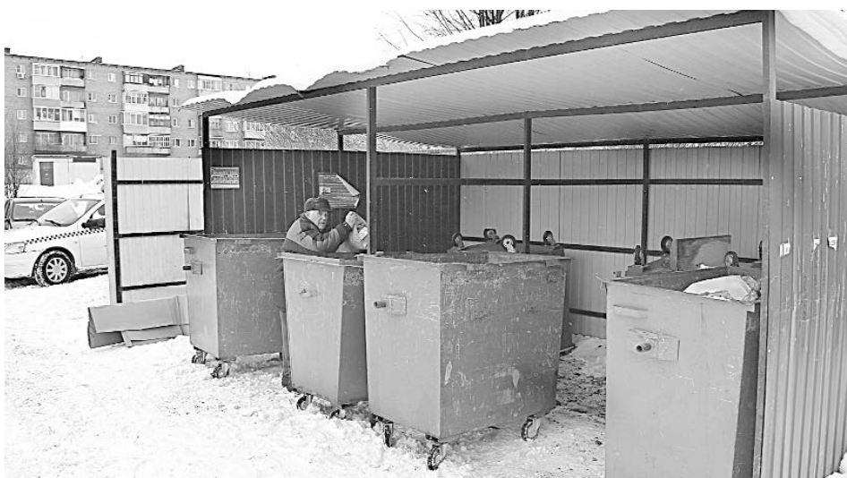
С марта т.г. начнут действовать новые требования СанПиНа к размещению контейнерных площадок

Количество мусоросборников, устанавливаемых на контейнерных площадках, определяется хозяйствующими субъектами в соответствии с установленными нормативами накопления ТКО. На контейнерных площадках должно размещаться не более 8 контейнеров для смешанного накопления ТКО или 12 контейнеров, из которых 4 - для раздельного накопления ТКО,