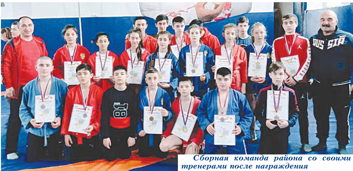
Сборная команда района со своими тренерами после награждения

В СОК ОЗАТЭ прошло открытое первенство ГБУ "СШ единоборств" по самбо среди юношей и девочек 2007-2009 гг.р.