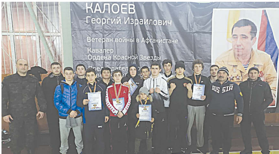
Победители и призеры б/к "Колизей" со своими тренерами

В спортивном зале завода "Победит" г. Владикавказа прошло первенство РСО-А по армейскому рукопашному бою, посвященный Дню вывода советских войск из Афганистана.