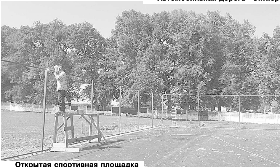
Открытая спортивная площадка

Сельский Дом культуры работает в соответствии с намеченными планами.