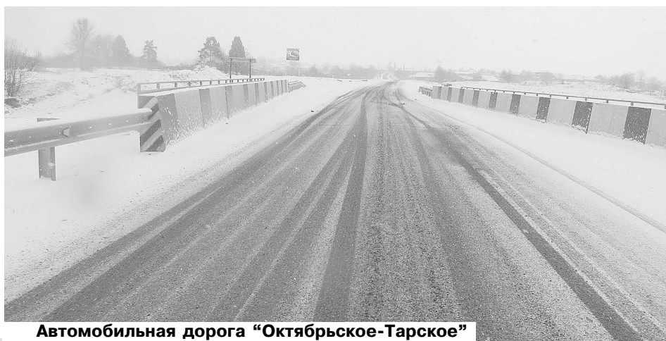
Автомобильная дорога "Октябрьское-Тарское"

Нами запланирована прокладка асфальтированных дорог от школы №1 по ул. Остаева и ямочный ремонт внутрисельских асфальтированных дорог, замена светильников уличного