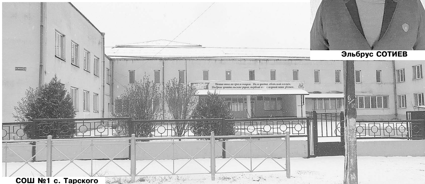
СОШ №1 с. Тарского

Когда проходит год и наступает новый, мы анализируем ушедший: с какими результатами его проводили... Радуемся за достигнутое как в работе, так и в личной жизни и надеемся на решение наболевших вопросов в новом году, намечаем планы на будущее.