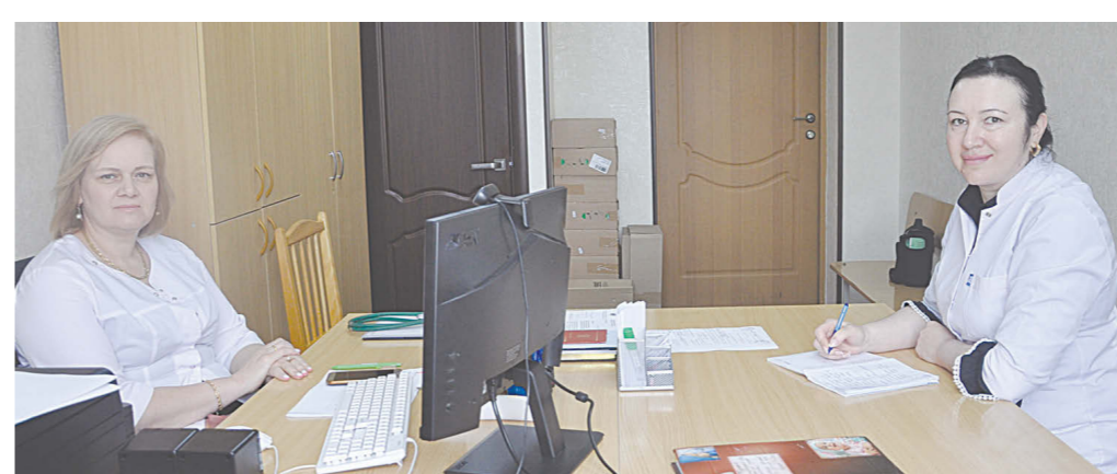
Сывæллæтты консультацийы хайады сæргълаууæг НАНИТЫ Дали æмæ медицинон хо ГУТНАТЫ Рита