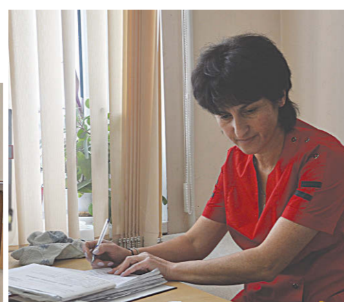
Рентгенкабинеты медицинон хо ДЗУКЪАТЫ Инна