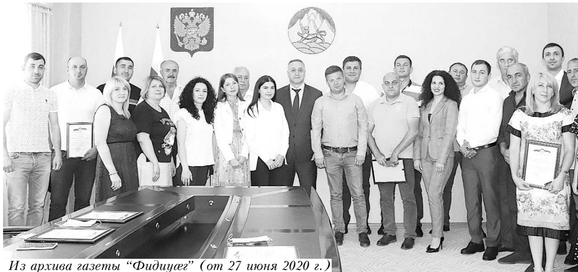
(от 27 июня 2020 г.)

В условиях самоизоляции, когда мир столкнулся лицом к лицу с невидимым врагом - новой коронавирусной инфекцией, для многих людей старше 60 лет и маломобильных граждан была жизненно необходима помощь.