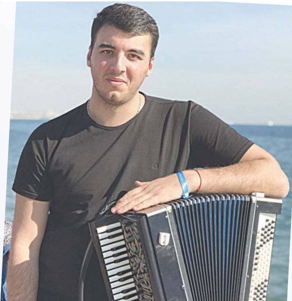
Заур ГАСИЕВ -