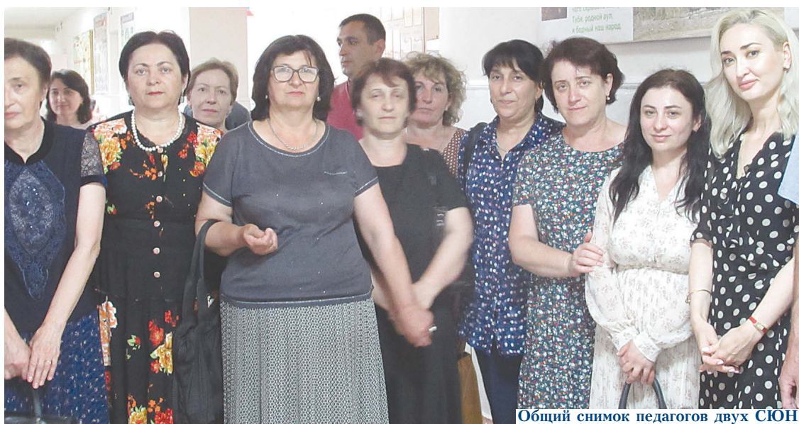
Общий снимок педагогов двух СЮН