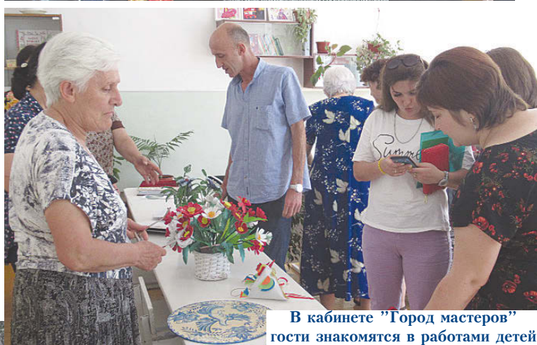
В кабинете "Город мастеров" гости знакомятся с работами детей