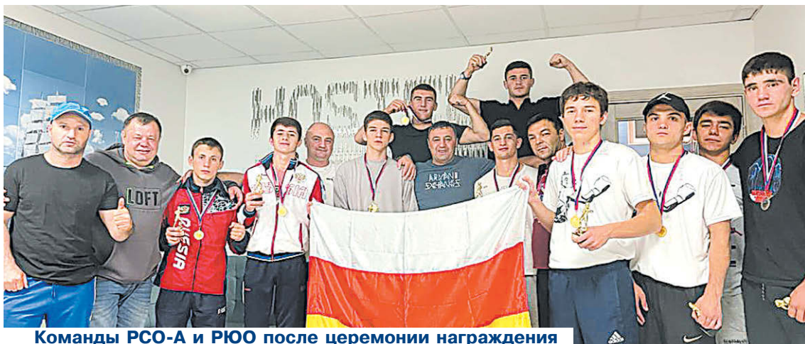
Команды РСО-А и РЮО после церемонии награждения

В г. Зеленоградске Калининградской области проходил Регулярный международный турнир по боксу "Балтийский ринг".