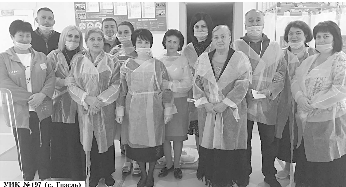
УИК №197 (с. Гизель)