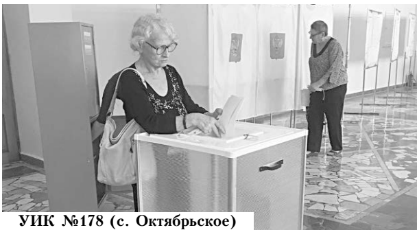
УИК №178 (с. Октябрьское)