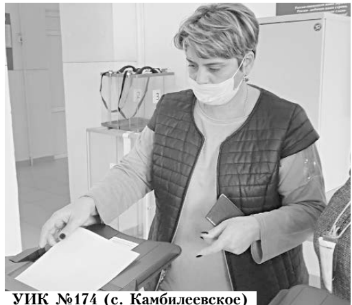
УИК №174 (с. Камбилеевское)