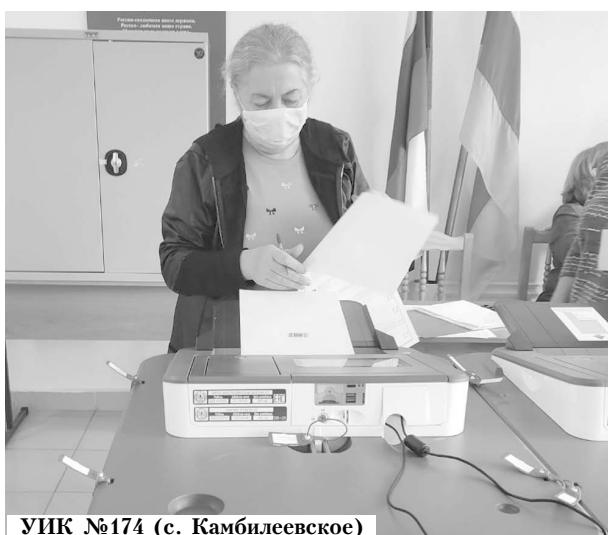
УИК №174 (с. Камбилеевское)