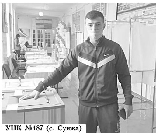
УИК №187 (с. Сунжа)