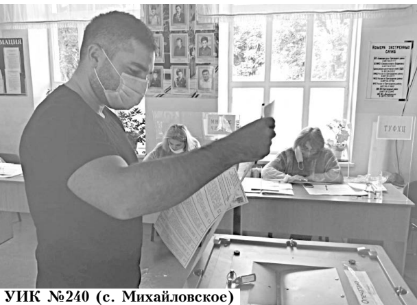
УИК №240 (с. Михайловское)