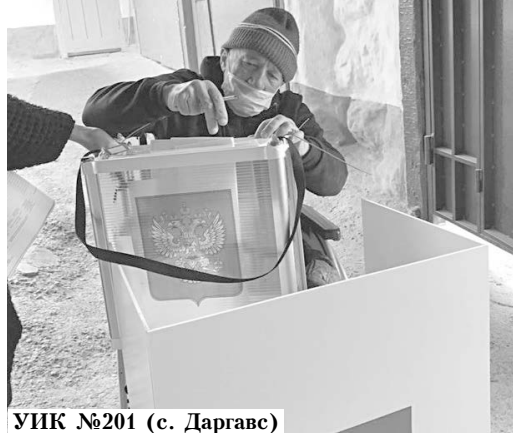
УИК №201 (с. Даргавс)