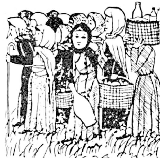
Къутæрджыны устытæ сабатизæрмæ фæцæуыны