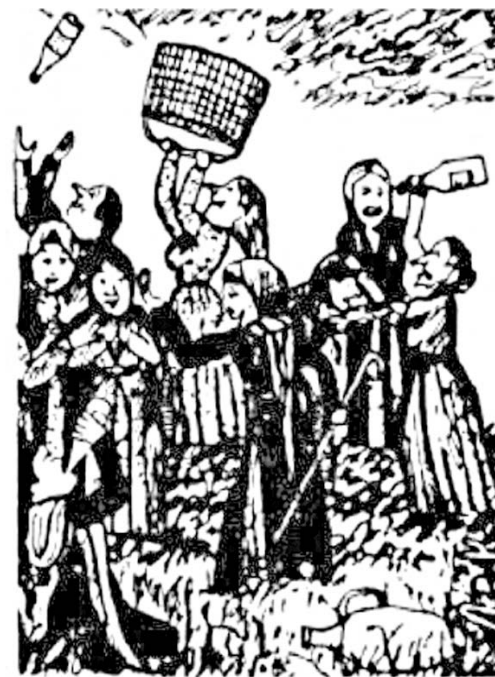
Къутæрджыны устытæ сабатизæрæй раздæхтысты