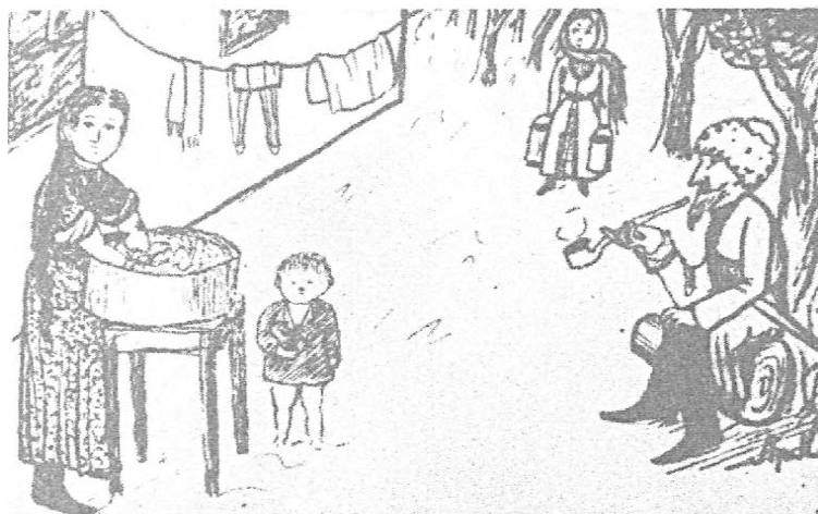
Æртæ чызджы фыд

Коцойты Арсен ма ахуыргæнæгæй куыста Цæгат Ирыстоны хъæуты дæр. Уæд ныффыста йæ зындгонд радзырдтæ "Фынддæс азы". "Фидис" æмæ æндæртæ.