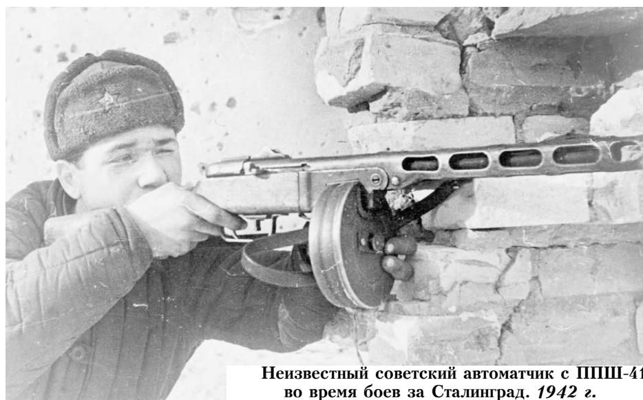
Неизвестный советский автоматчик с ППШ-41 во время боев за Сталинград. 1942 г.

Нанеся удары по флангам главной группировки противника, войска Юго-Западного и Сталинградского фронтов 23 ноября 1942 года замкнули кольцо ее окружения. В него попали 22 диви-