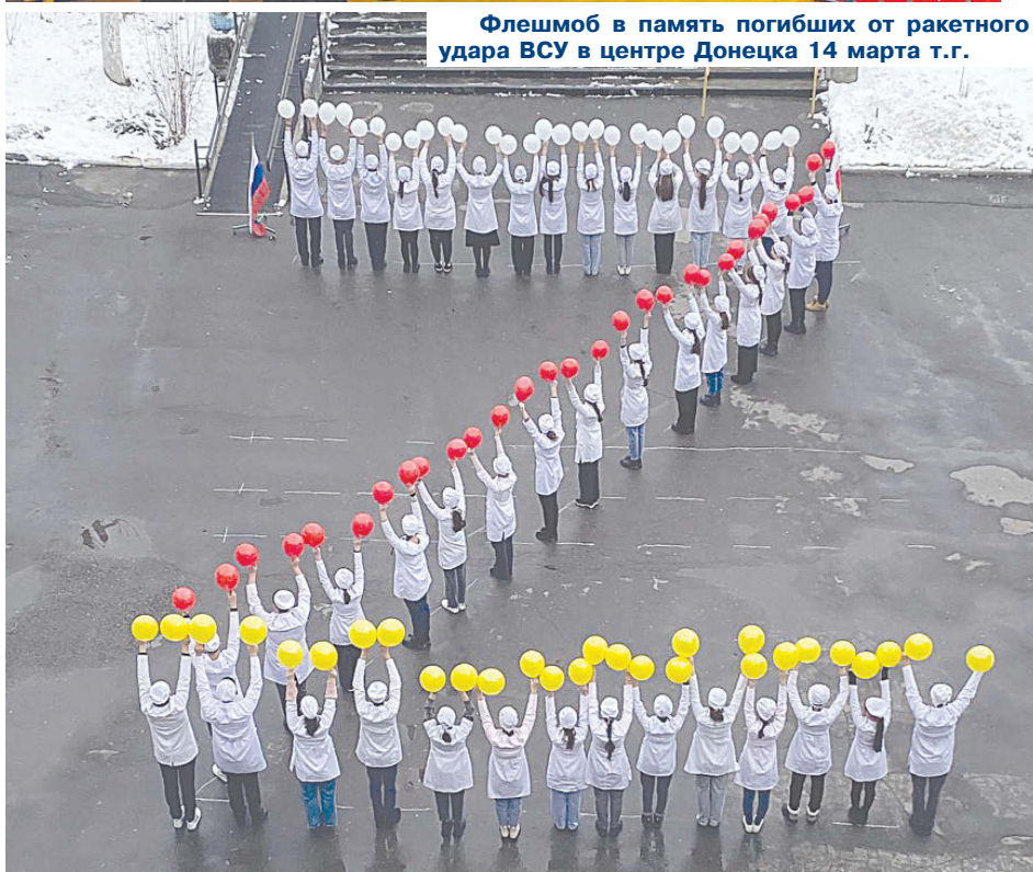
Флэшмоб в память погибших от ракетного удара ВСУ в центре Донецка 14 марта т.г.