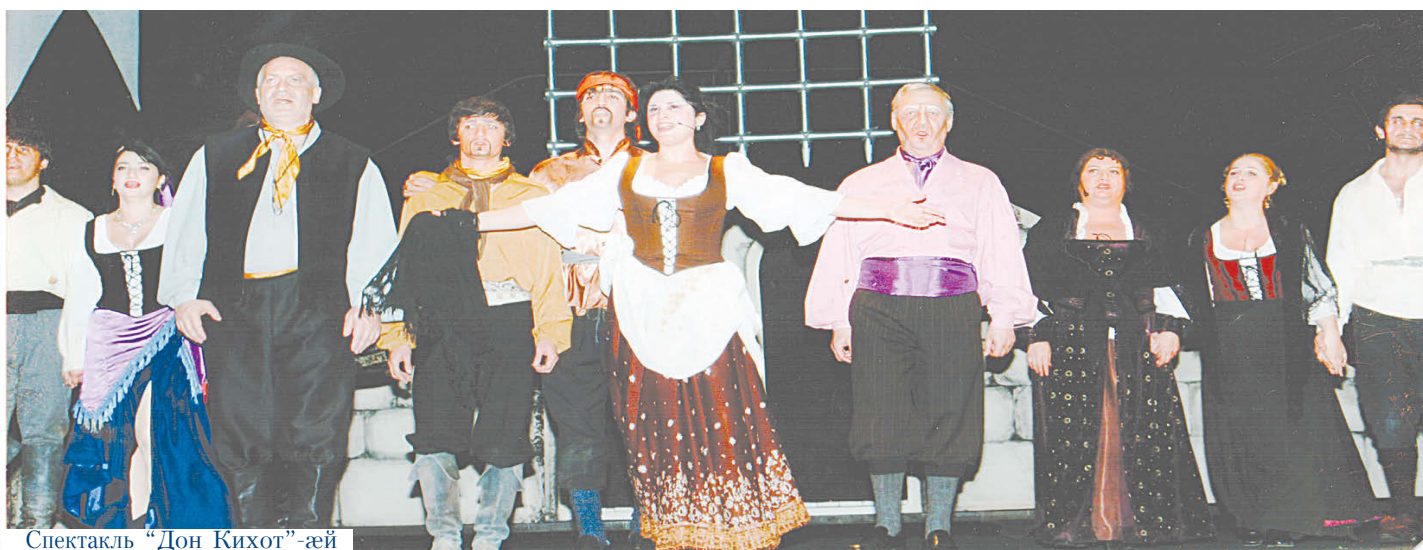
Спектакль "Дон Кихот"-æй