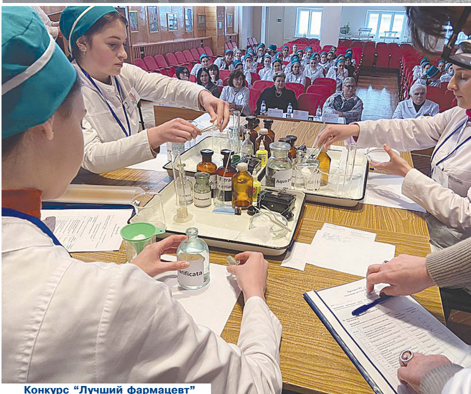
Конкурс ”Лучший фармацевт”

уже около 240 имен. Памятники врачам имеются, а вот среднему медперсоналу если и есть, то очень мало”.