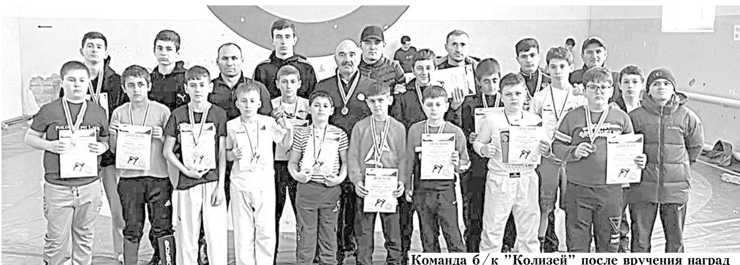
Команда б/к "Колизей" после вручения наград

Иностранцы подлежат обязательной дактилоскопической регистрации и фотографированию