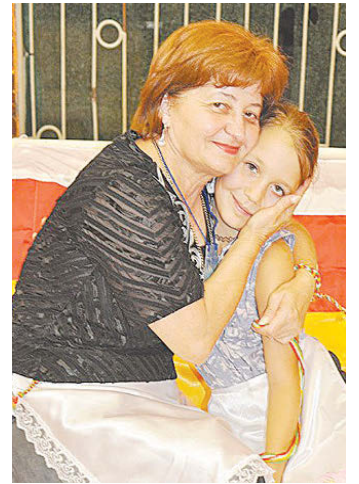
бахаста - Мады-Майрæмыл æй бафæдзæхста.