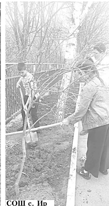
СОШ с. Ир