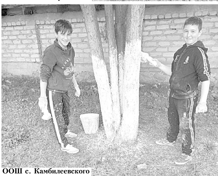
ООШ с. Камбилеевского