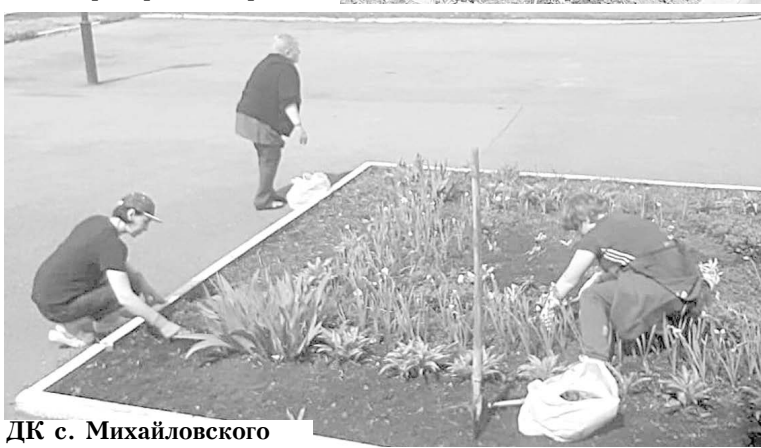
ДК с. Михайловского