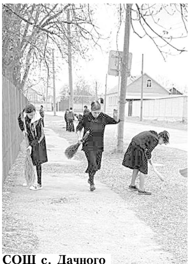
СОШ с. Дачного