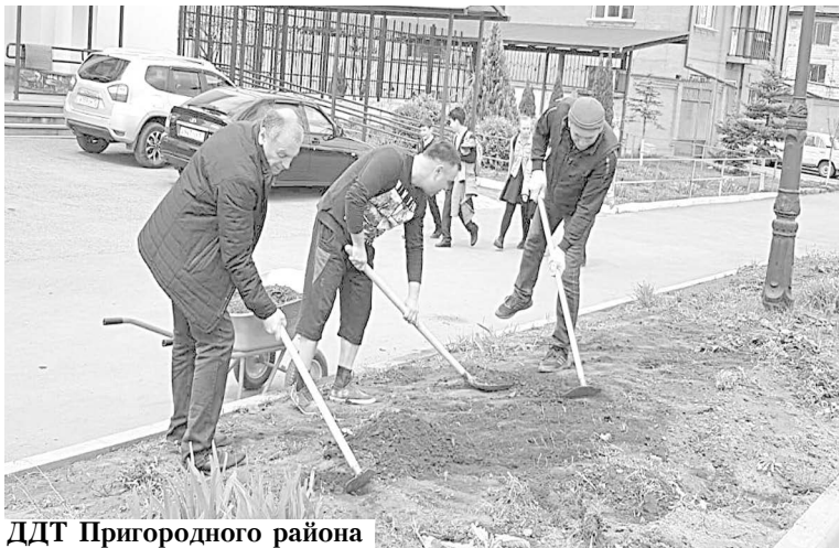
ДДТ Пригородного района