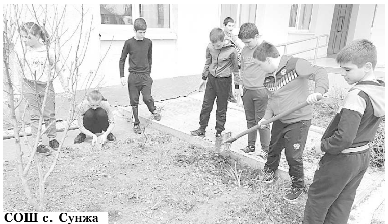
Редакция СОШ с. Сунжа