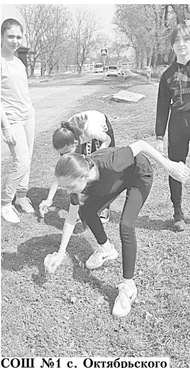
СОШ №1 с. Октябрьского