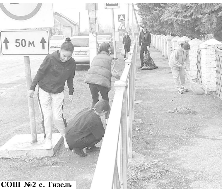
СОШ №2 с. Гизель