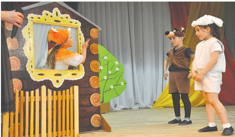
Д/с №1 с. Камбилеевского

”Иры фидæн”. Под таким лозунгом в районном Доме детского творчества прошел муниципальный этап конкурса среди воспитанников дошкольных учреждений, организованный Управлением образования Пригородного района.