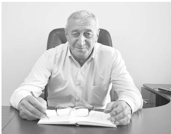
уый аразын райдыдтой.

Хицæн арфæйы ныхæстæ мæ зæгъын фæнды нæ республикæйы сæргълæууæг Сергей Меньяйлойæн . Стыр æххуыс нын бакодта: куыддæр æм "баулæфыдыстæм" нæ фæндаджы уавæры тыххæй, афтæ цалдæр боны фæстæ æвæстиатæй, Хъобанæй Хъæрмæдонмæ цы фæндаг цæуы,