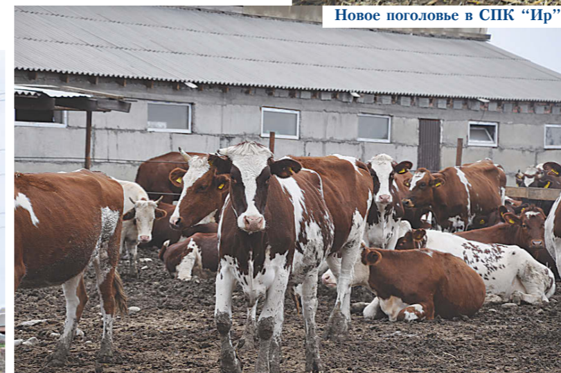
Новое поголовье в СПК "Ир"