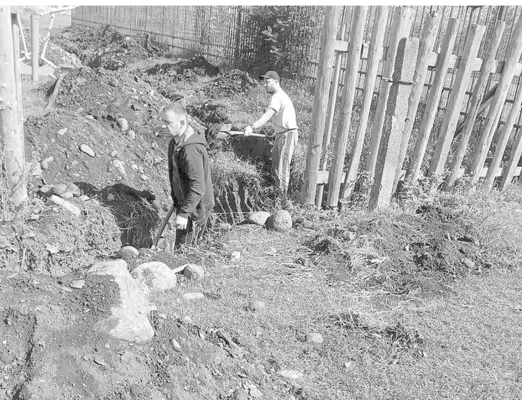
К СОШ №2 с. Ногир проводится водопроводная линия

Благодаря их добросовестному и качественному труду были отремонтированы котельные "Ирбис"-а, "ОПХ" и средней общеобразовательной школы, произведен ремонт всех инженерных сетей в подвалах многоквартирных домов (М/Д), заменили 100 м водопроводных линий по селу. Осуществили замену циркуляционных насосов во всех котельных. Заменили также 150 м теплотрассы от котельной "Ирбис". Произведена замена теплотрассы протяженностью около 30 м от школьной котельной по ул. Гагарина. Такая же операция на 30 м осуществлена в котельной "ОПХ". Много работ провели по техобслуживанию запорных арматур, стояков, труб и вентилях. Во всех котельных произведен ремонт котлов. В Алханчурте поменяли 100 м водопроводных линий. Произведена опрессовка котельных и отопительных сетей. Они уже готовы к эксплуатации.