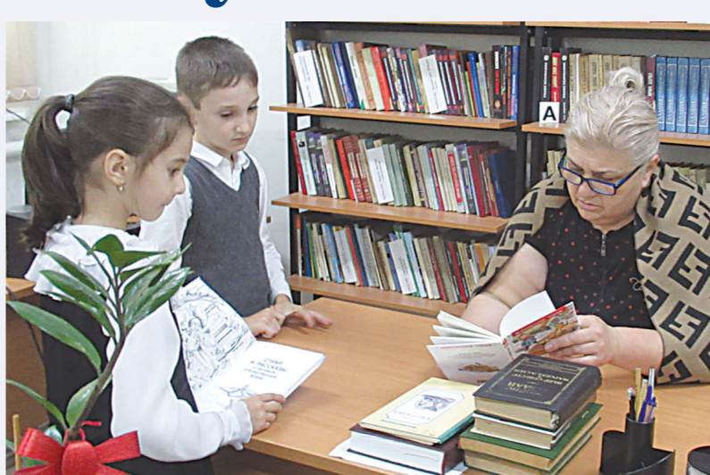
Юные читатели библиотеки

Центральная районная библиотека, учитывая интересы наших абонентов, пополнила наш книжный фонд новой литературой. Ею пользуются не только школьники и студенты, но и взрослое население, даже люди пожилого возраста. По просьбе последних приношу необходимую литературу к ним на дом, - говорит Изольда. Особым интересом среди