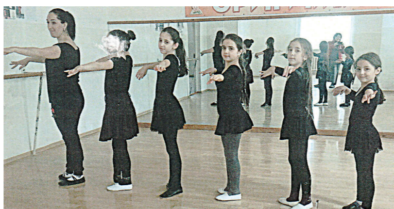
Репетиция хореографического кружка