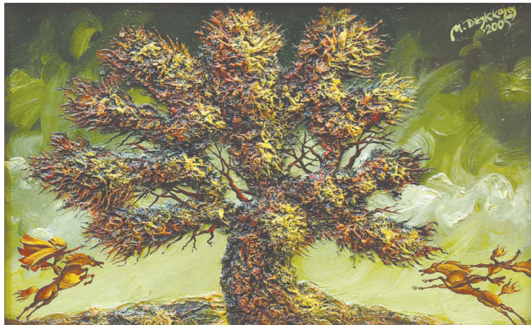
“Битва нарга Ацамаза с фараоном Египта”