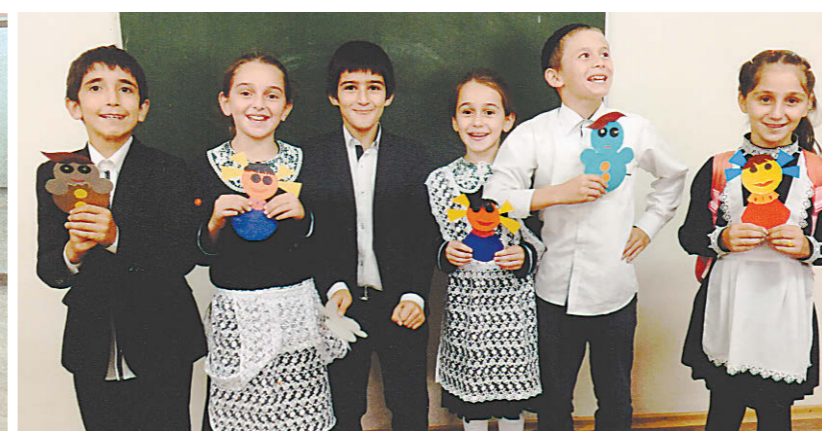
Участники кружка "Умелые ручки"