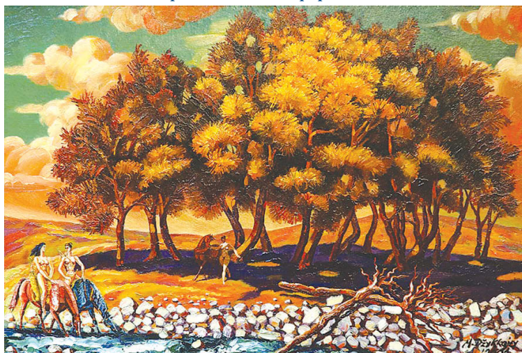
“В царстве амазонок”