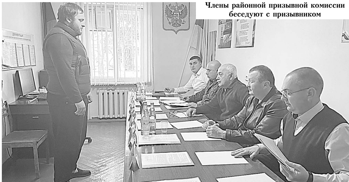
Члены районной призывной комиссии беседуют с призывником

Ребята ждут службу в сухопутных, военно-воздушных, железнодорожных войсках, ВДВ и войсках нацио-