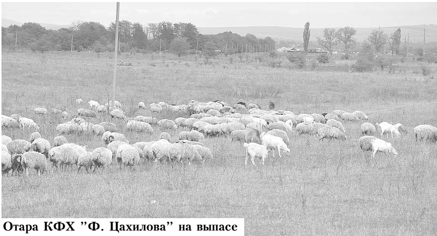
Отара КФХ "Ф. Цахилова" на выпасе

Овцеводство - это составляющая часть отрасли животноводства. В советские времена овцеводство было достаточно развито. В каждом колхозе или совхозе было по несколько отар, где насчитывалась до 3 и более тысяч голов. Тогда на продукцию овцеводства (мясо, шерсть) составлялись государственные планы, и они всегда выполнялись.