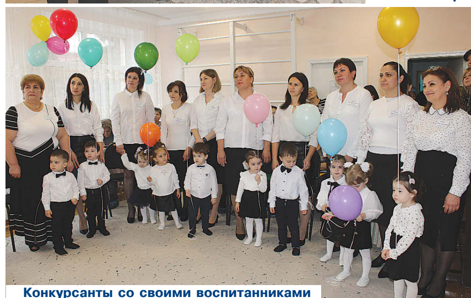
Конкурсанты со своими воспитанниками

"Воспитатель года России" является Управление образования АМС МО Пригородный район.