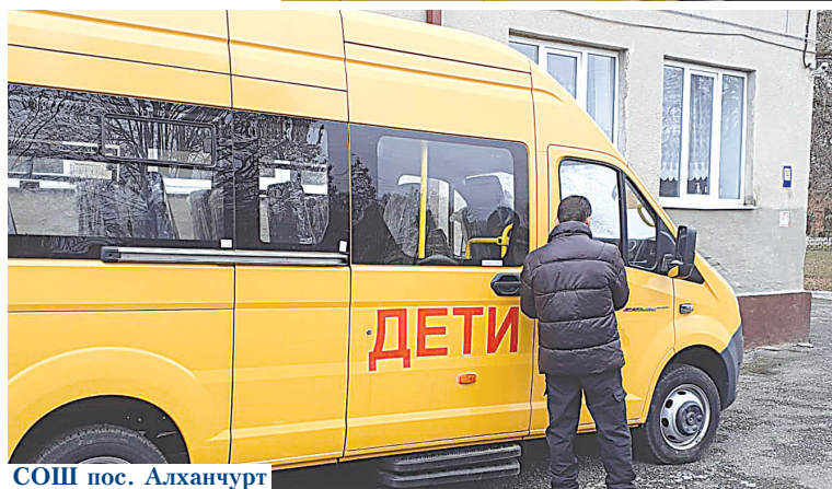
СОШ пос. Алханчурт