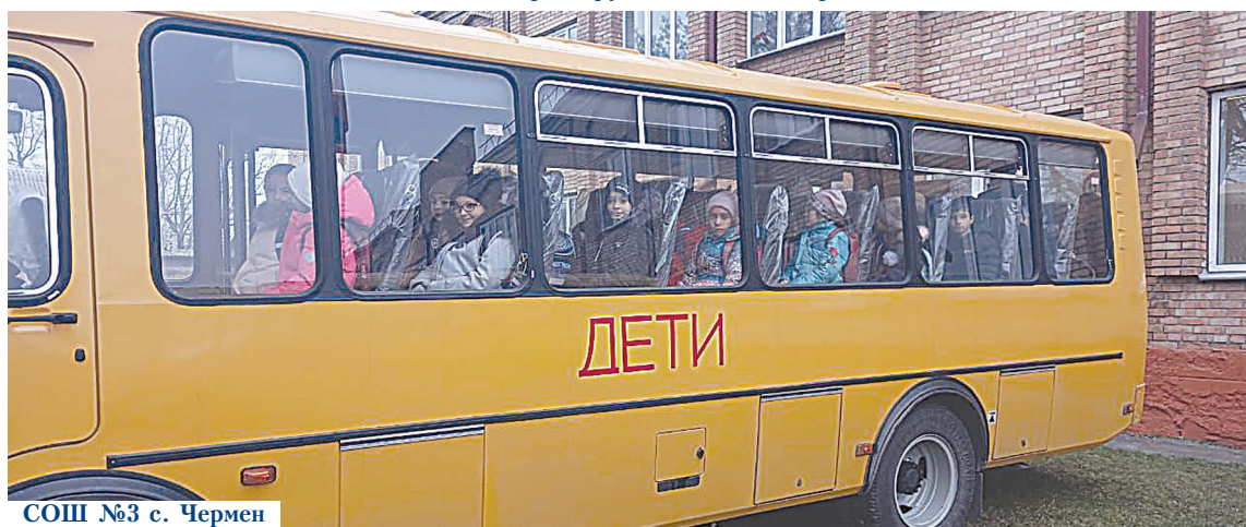
СОШ №3 с. Чермен