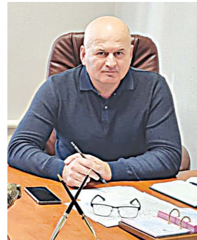
мæй æййафа, алчидæр райгонд уа йæ царды уавæртæй.

- Нæ авналæнтæ, ома æхцайы фæргæзтæ, парахатдæр куды уаивтæ, парахатдæр макæмæй баззайой, ууыл. Зæргъæм, кудыд республикæйы бирæ хъæуты, афтæ Санибайы дæр доны фарста уыди