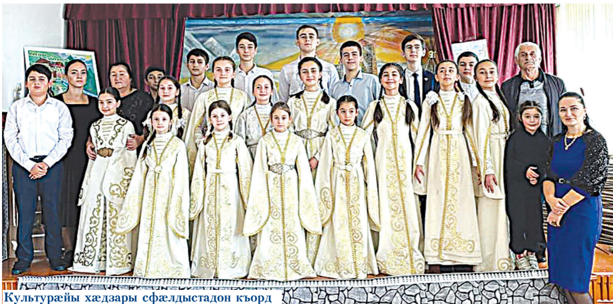
Культурæйы хæдзары сфæлдыстадон къорд

Абон та уал Ног азы къæсæрыл лæууæм, æмæ мæ хъæубæстæн зæрдиæг арфæтæ æрвитын. Мæ зæрдæ алы хæдзарæн дæр зæгъы æнæниз æмæ æнæмæст цард, уды сыгдæгдзинад! Украинæйы сæрмагонд операцийы цы хъæбултæ архайыцц нæ хъæуæй, уыдон сæргæгасæй сæмбæлæнт сæ къонатыл! Лæгты Дзуары уæзæг уæнт!