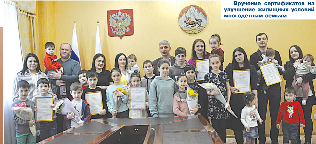
Вручение сертификатов на улучшение жилищных условий многодетным семьям

Конец года - время подводить итоги. Давайте вспомним самые значимые события, которые произошли в Пригородном районе за этот год и сделали его ярким и запоминающимся.