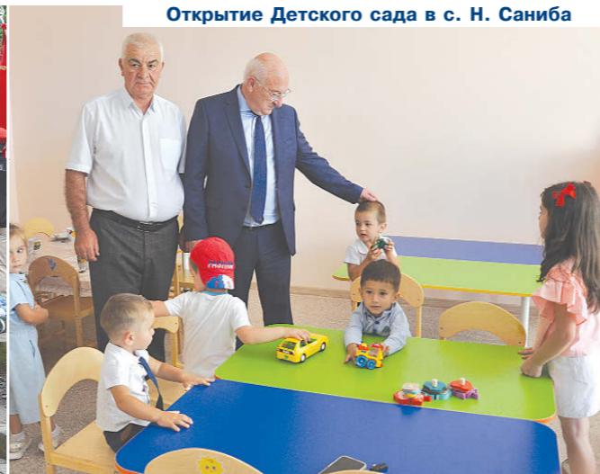
Открытие Детского сада в с. Н. Саниба