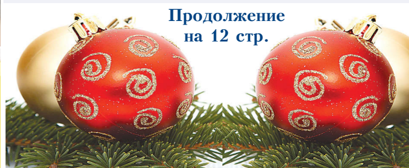
Продолжение на 12 стр.