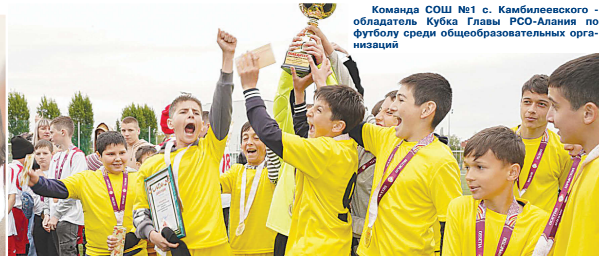
Команда СОШ №1 с. Камбилеевского - обладатель Кубка Главы РСО-Алания по футболу среди общеобразовательных организаций