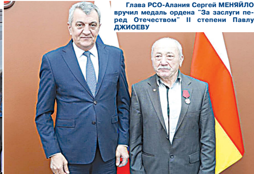
Глава РСО-Алания Сергей МЕНЯЙЛО вручил медаль ордена "За заслуги перед Отечеством" II степени Павлу ДЖИЙЕВУ