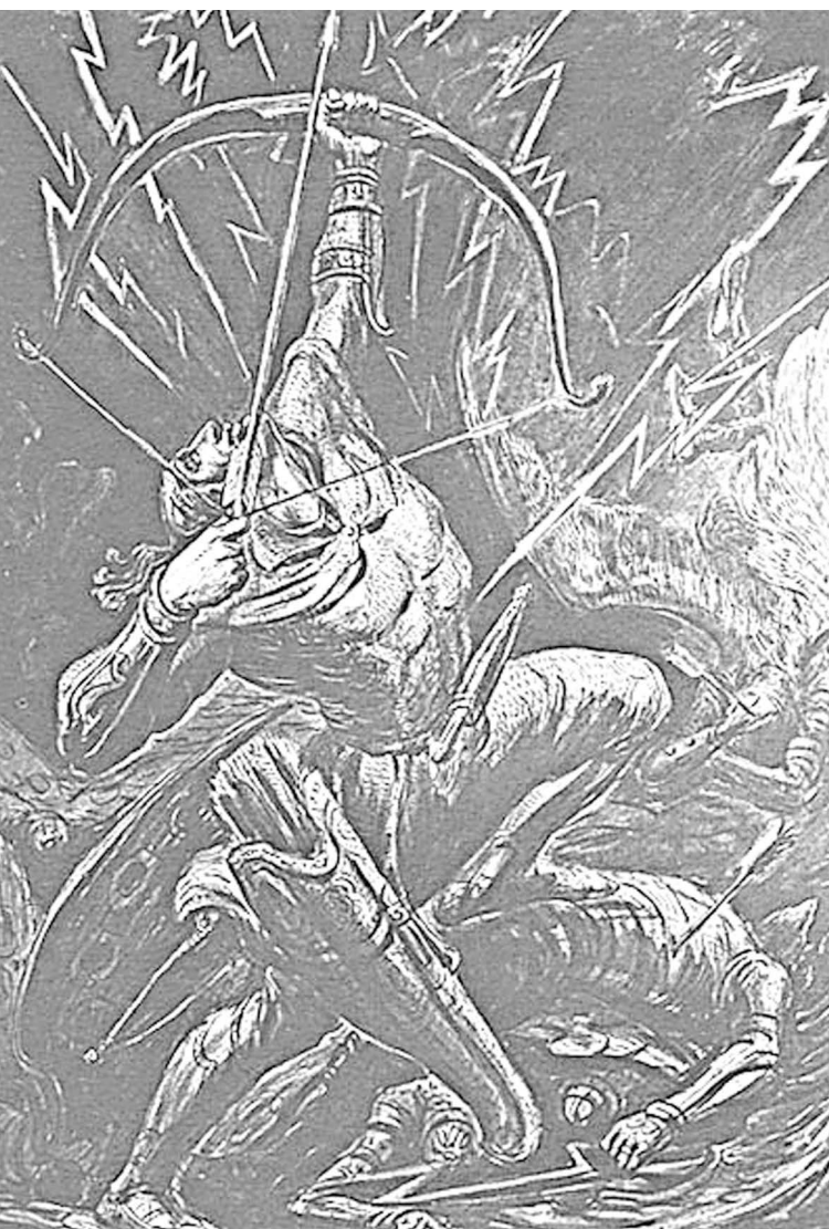
"Батрадзы тох зæдтæ æмæ дауджытимæ"

Ацырухс Хуры чызг, нарты Сосланы æртыккаг ус. Сослан æй куы куырда, уæд уæйгуыты домæн уыд, цæмæй Сослан