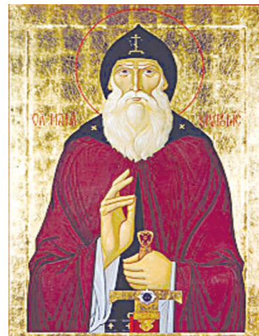
Преподобный Илья МУРОМЕЦ

Исследование мумифицированных останков богатыря специалистами судебной медицины пролило свет на причину его смерти. Муромец умер от обширной раны в области сердца. На теле бы-