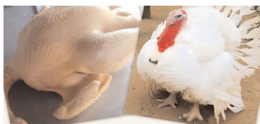
ИНДЕЙКА ВЫСШЕГО КАЧЕСТВА.

Тушка от 10кг до 15 кг. Цена: 400 руб за кг.