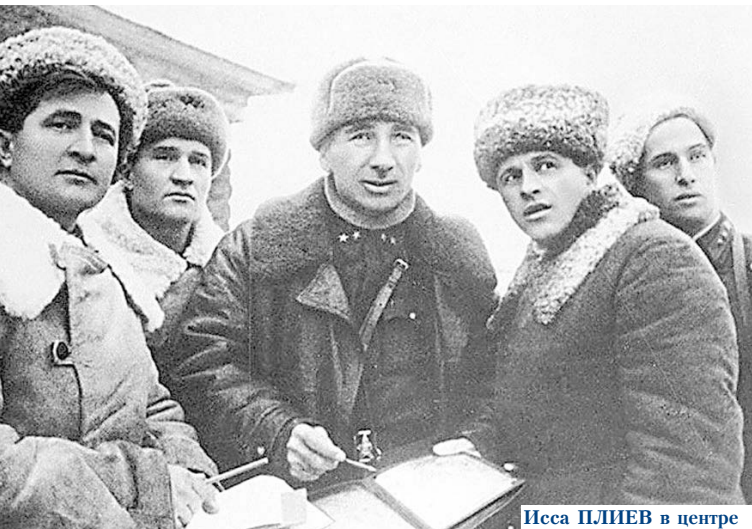
Исса ПЛИЕВ в центре

Под Сталинградом с немецкими войсками сражались русские, казахи, узбеки, чувашаи, ненцы, нанайцы, татары и представители многих других народов. Сегодня рассказываем о вкладе сынов и дочерей Осетии в дело разгрома немецких войск под Сталинградом.