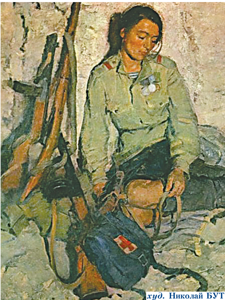
худ. Николай БУТ