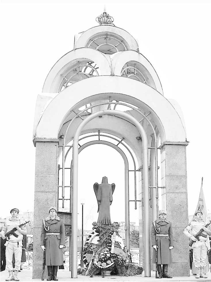
Памятник воинам-интернационалистам в г. Владикавказе