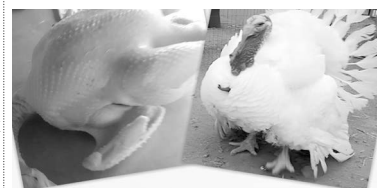
ИНДЕЙКА ВЫСШЕГО КАЧЕСТВА.

газеты принимает объявления, поздравления, рекламные блоки (кроме субботы и воскресенья) от частных лиц и трудовых коллективов с 10 до 16 часов. Перерыв - с 13 до 14 часов.