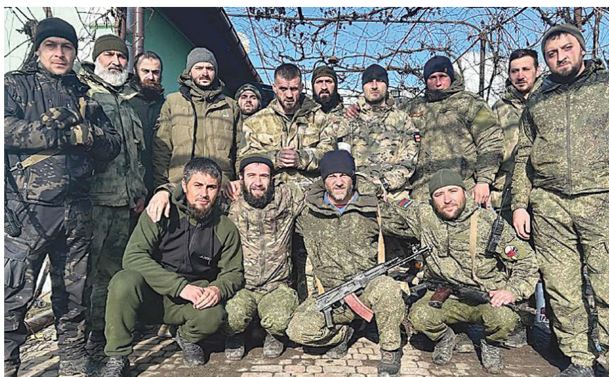
Часть бойцов отряда "Шторм.Осетия" со своим командиром (позывной "Король") Отряд считается одним из лучших на Запорожском направлении