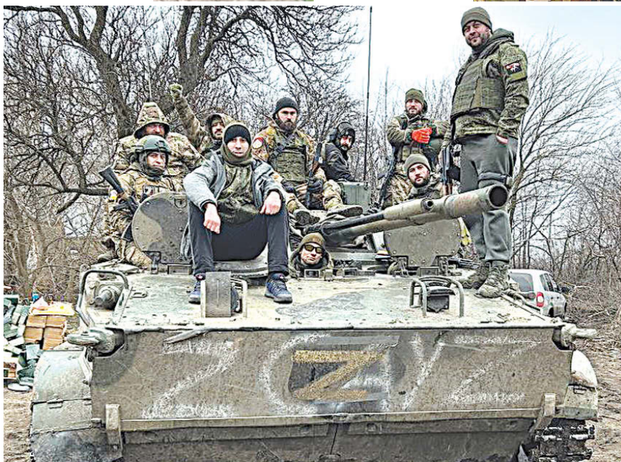
Отряд "Шторм.Осетия" к выполнению поставленных задач готов