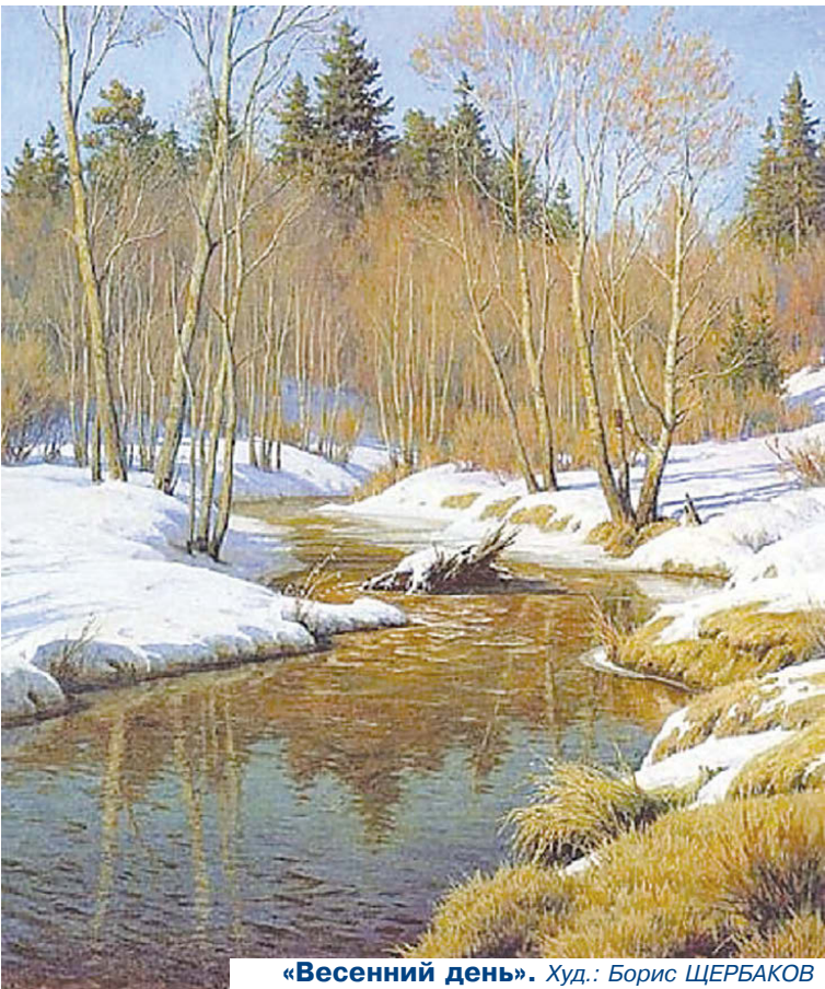
«Весенний день». Худ.: Борис ЩЕРБАКОВ

Март - первый месяц весны. Вместе с ним приходят оттепели, тает снег, журчат ручьи, расцветают подснежники, начинают возвращаться первые птицы из далеких теплых краев. В воздухе начинает пахнуть свежестью.