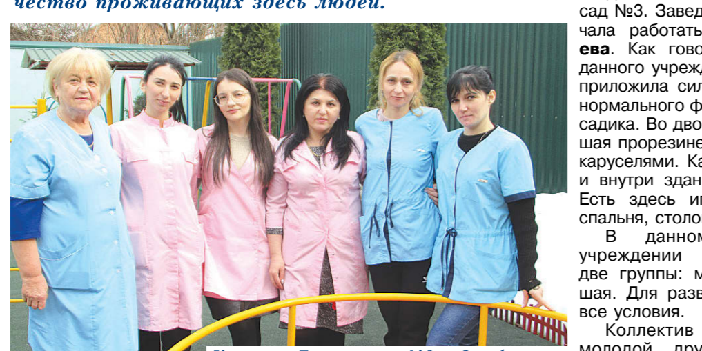
Коллектив Детского сада №3 с. Октябрьского

В юго-восточной части с. Октябрьского, начиная от улицы 8 Марта и вплоть до окраины села, наравне с давно построенными домами немало новых домовладений. А значит, увеличилось и количество проживающих здесь людей.