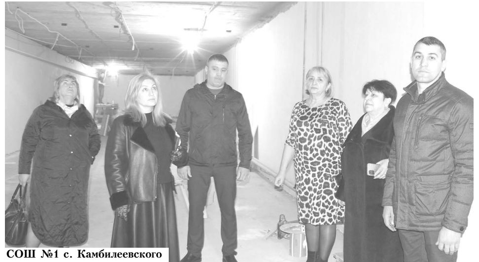
СОШ №1 с. Камбилеевского