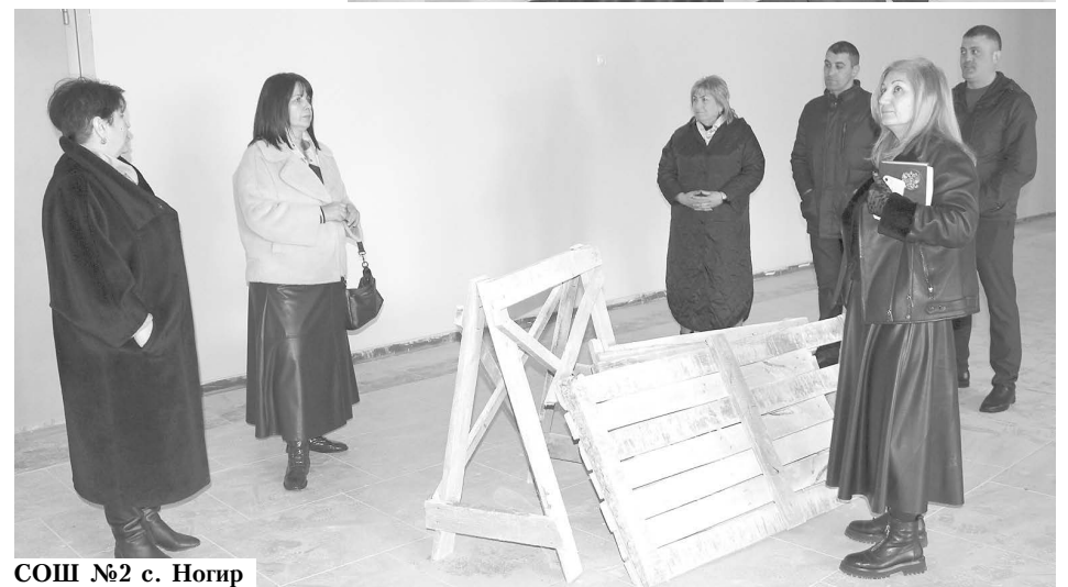
СОШ №2 с. Ногир