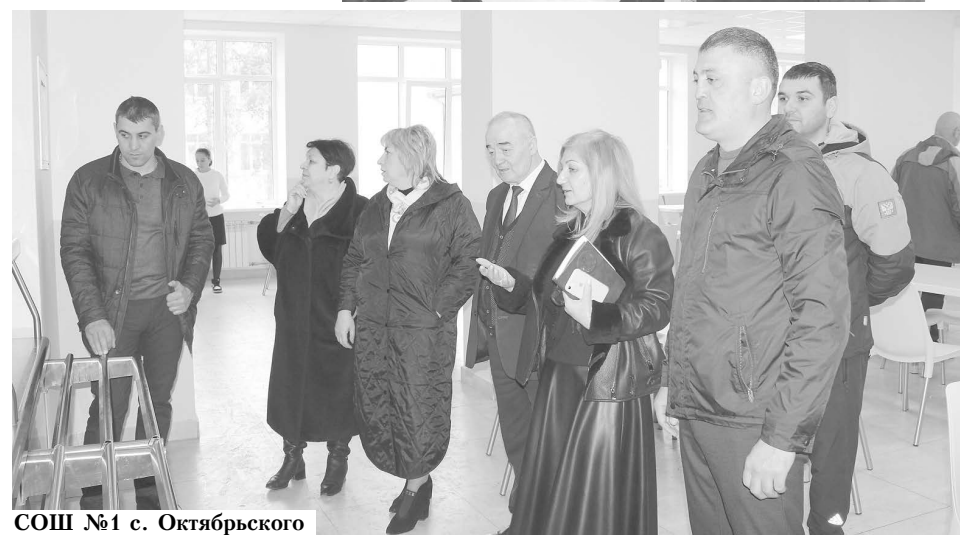
СОШ №1 с. Октябрьского