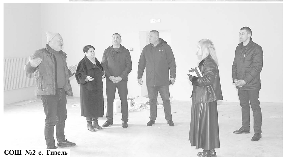
СОШ №2 с. Гизель

ные материалы. Депутаты отметили и эстетичный вид отремонтированных кабинетов учебного заведения. Каждый этаж школы выполнен в своей цветовой гамме.