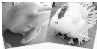
ИНДЕЙКА ВЫСШЕГО КАЧЕСТВА.

✓РЕМОНТ стиральных машин на дому. Качественно! Оригинальные запчасти. Гарантия. Тел.: 8-960-402-46-26, 8-919-424-20-52. 147