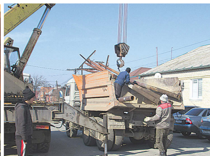
Отделение электриков разбирают старые столбы