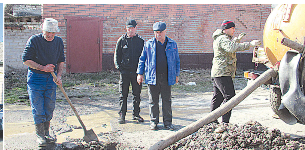
Работники водоканала устраняют утечку воды