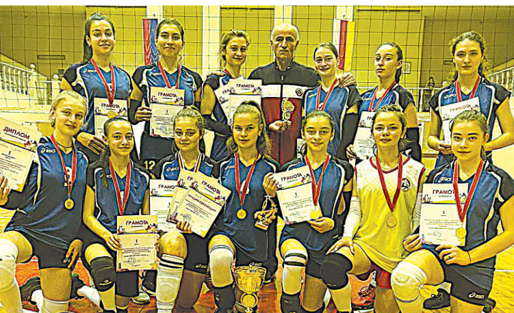
Команда-победительница "Амонд" с. Сунжа

С 10 по 12 марта в спортивно-оздоровительном комплексе им. Е. Тедеева проходил открытый турнир по волейболу среди девушек 2007-2008 гг.р.