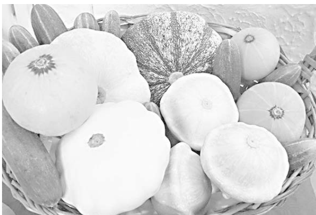
Криница, Обелиск, Всадник.

Для открытого грунта в черноземной зоне наиболее распространены сорта: для засола и консервирования - Водолей, Конкурент, Харьковский, гибрид Р1, Великолепный; универсального назначения Вяжниковский, Нежинский, гибрид F1, Бригадный; для механизированного возделывания и уборки - Кустовой, Короткоплетистый 81, Старт 100, Конкурент и др. Наиболее урожайны в открытом грунте в условиях распространения пероноспороза сорта Бригадный, Конкурент, Водолей, Кустовой,