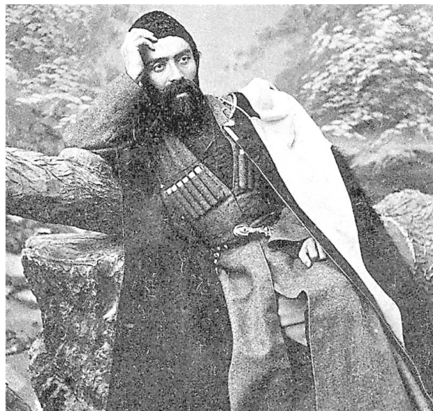
Сау галтә сау адәм сау зәххыл ласынц, Цьәх наууыл цьәх цухъхъаджынтә цьәх арахъхъ нууазынц.

Ахәм дзәбәх әнцәд-әнцәй цард сын куы уыда-ид, уәд ма Ирыстоны зәхкусдҗыты цы хуыдаид! Фәлә уый уыдыс әнәуд ныв, цардән йә тәф дәр кәмә нә хәццә кодта, ахәм ныв. Царды сәрты кәсгәйә йә фыста автор әмә, Кьостайы "Хуыба-ды"-йы, "Чи дә"-йы әмә әндәртты цы хәххон адә-мы хәләс хуыст, уый йәм хуысгә дәр нә код-та. Нодҗы ма "Гәләбу" сывәлләттән фыст кәй уыд, уый сә ферох, әмә сын әй Кьоста сә зәрдыл әрләууын кодта ахәм пародийә: