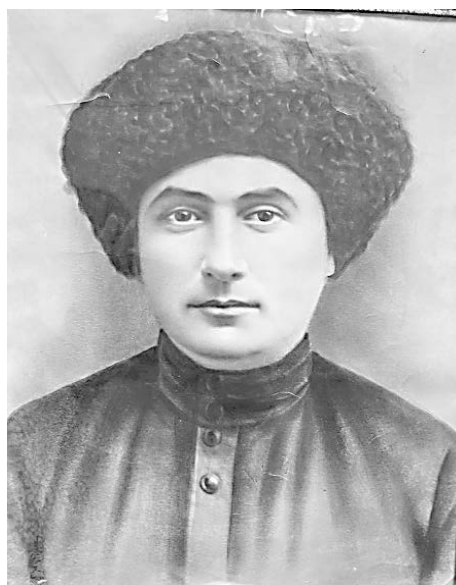
Варычкæ æнхъæлмæ каст.

Искæцæй-иу исты хæстон хабар куы райхъуыст, уæд-иу æм тынг ныхъхъуыста, кæд Хазбийы тыххæй исты базонид, зæгъгæ. Бирæ рæстæг рацыд, уæддæр ма йæм