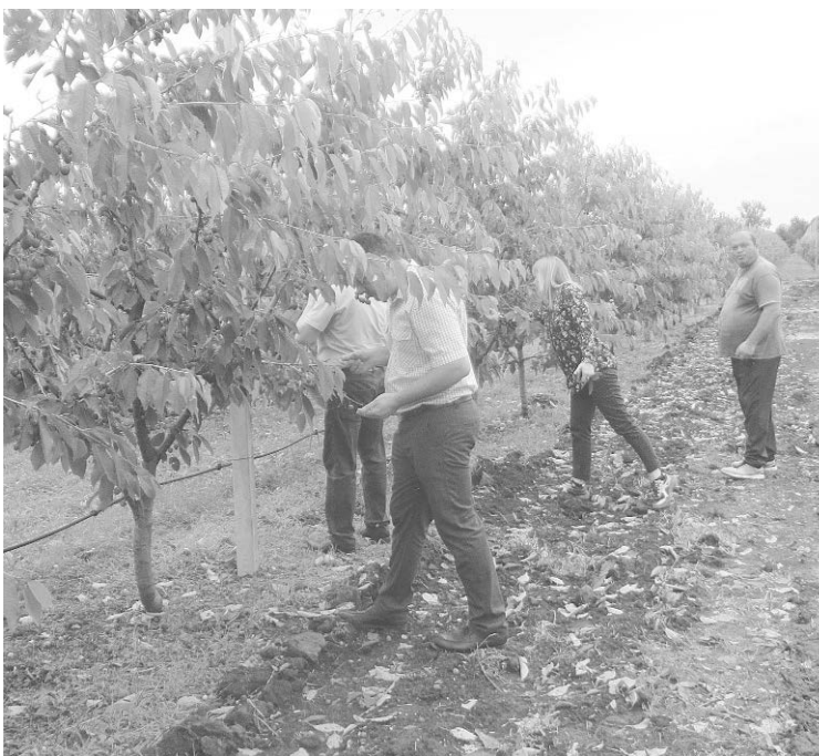
Так выглядит сад черешни после прошедшего града

Прошедший в минувший вторник град нанес ощутимый ущерб некоторым районам республики. Пострадал от природной стихии и Пригородный район.