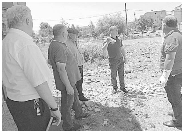
Выясняются причины придорожной полосы

Селение Михайловское находится недалеко от г. Владикавказа, но оно ничем особенным не отличается от других населенных пунктов Пригородного района. Проживает здесь свыше 10 тысяч человек. Социально-бытовые условия, жилищные проблемы такие же, как и в других селах. Это - уличное освещение, оборот твердых коммунальных отходов, благоустройство общественных зон, строительство и ремонт дорог, водоснабжение, доступность медицинских услуг и другие. И решаются эти вопросы в непрерывном режиме. Подтверждением тому очередной факт.