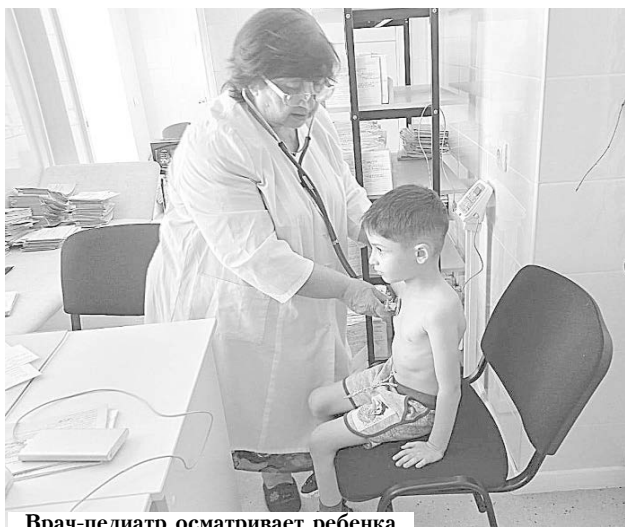
Врач-педиатр осматривает ребенка

"Наша амбулатория обеспечена всем необходимым оборудованием. Для оказания первой медицинской помощи имеется достаточно медикаментов.