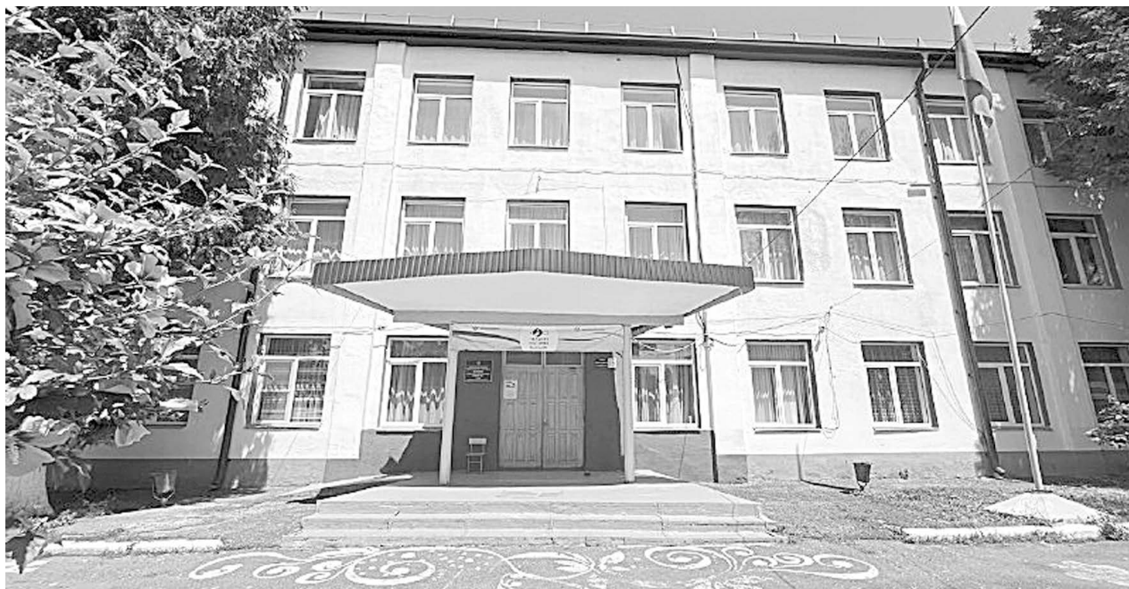
Чермены 2-æм астæуккаг скъола

Косметикон цалцæг цæмæй тагъд ахицæн уа, ууыл хорз бакуыстой æмæ кусынц скъолайы ди-