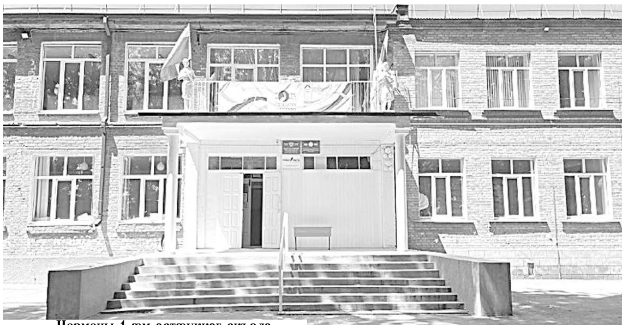
Чермены 1-æм астæуккаг скъола

Ног ахуыры азмæ сæхи цæттæ кæнынц нæ районы Чермены-хъæуы иумæйагахуырадон скъолатæ. Мах дзы бабæрæг кодтам дыууæ ахуыргæнæн уагдоны - 1-аг æмæ 2-аг.