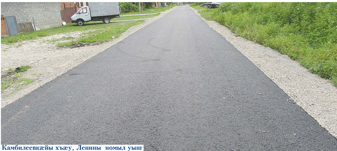
Камбилеевкæйы хъæу, Ленины номыл уынг

Ам донцæуæн хæтæлтæ раджы сæвæрдтой, фæлæ базæронд сты, цалцæг кæнынæн дæр нал бæззыдысты. Уынджы цæрджытæ арæх хъаст кодтой уæлдæрлаууæг инстанцитæм. Ивгъуыд азы октябры мæйы кæрон нæ районы администраци йæхи бюджеты фæрæзтæй æвæрын райдыдта ацы уынджы зæххы бын донцæуæн ног хæтæлтæ. Куыстытæ сæххæст кодта Паддзахадон унитарон куыстуат "Коммунресурс" йæхи кусæгды æмæ техникæйæ. Алы хæдзар дæр Терешковæйы уынджы цæрджытæй дон йæхимæ бауагъта.