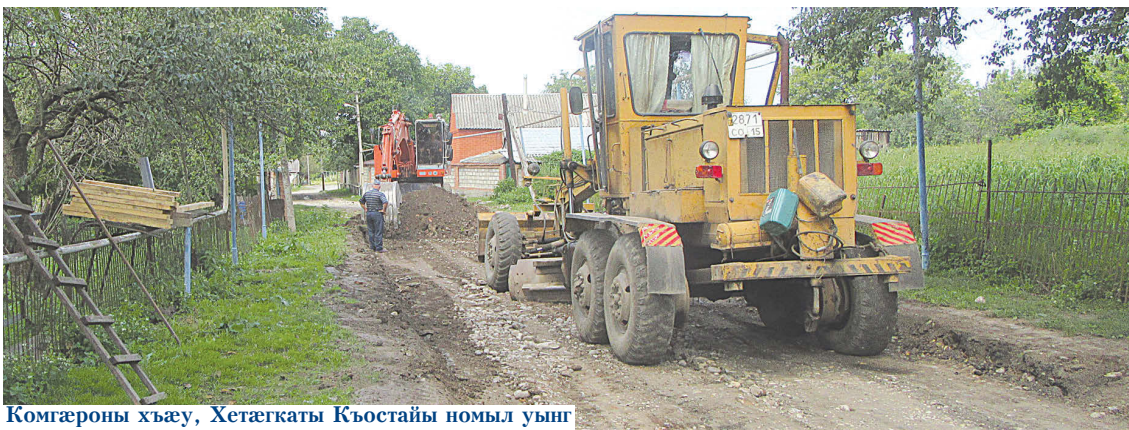
Комгæроны хъæу, Хетæгкаты Къостайы номыл уынг