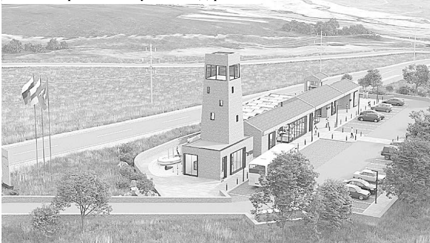
Эскиз будущего придорожного комплекса с интерактивным музеем в с. Даргавсе

Руководство республики на развитие туризма делает особую ставку как на перспективное направление. Но мало привлечь туриста, необходимо создавать еще и современную инфраструктуру для удобства и комфорта наших гостей, да и жителей республики тоже. Для этого нужно строить гостиницы, турбазы, улучшать дорожную инфраструктуру и т.д.