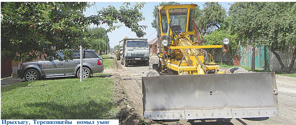
Ирыхъæу, Терешковæйы номыл уынг

Нæ районы Ирыхъæуы сæйраг уынг у тæхæг-космонавт Валентина Терешковæйы номыл. Йæ дæргъ - 1,5 километры.