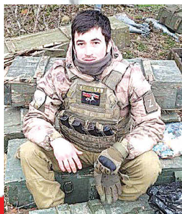
БАЛАТЫ Хетæг - майдан "Украинаей сæрмагонд æфсæддон операций архайæг"