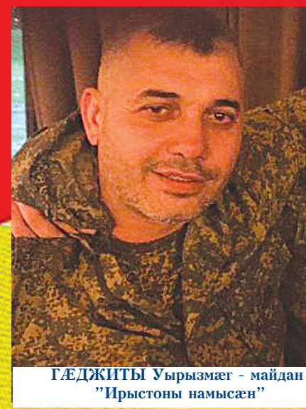
ГÆДЖИТЫ Уырызмаг - майдан "Ирыстоны намусæн"

Рагæй-æрæгмæ дæр-уу, райгуырæн бæстæйы сæрмæ сау мигътæ куы 'рбамбырд сты, уæд-уу йæ сæраппонд æрлæууыдысты нæ хуымæтæг, фæлæ хъæбатыр, ныфсджын лæппутæ, кæцты зæрдæтæ дзаг уыдысты уарзондзинадæй Фыдыбæстæмæ. Сæ туджы уыдис цард раттын уарзон адæм æмæ райгуырæн зæххы сæрвæлтау.