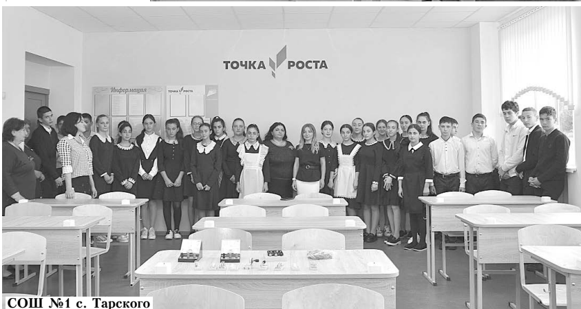
СОШ №1 с. Тарского