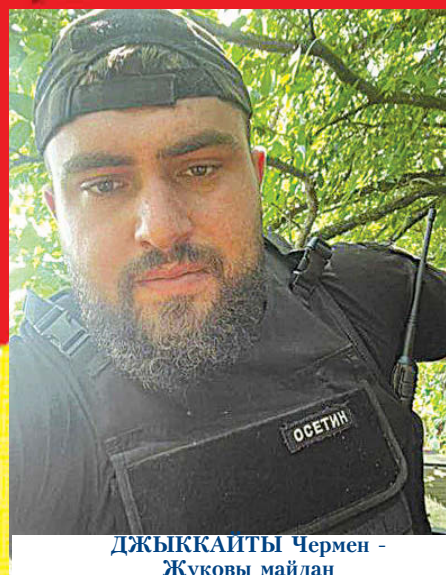
ДЖЫККАИТЫ Чермен - Жуковы майдан