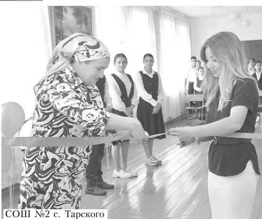
СОШ №2 с. Тарского

"Точки роста" оснащаются современной оргтехникой, тренажерами-манекенами, квадрокоптерами. Они дают нашим ребятам возможность приобрести навыки работы в команде, подготовиться к участию в различных конкурсах, и делают это весьма успешно. Для работы в "точ-