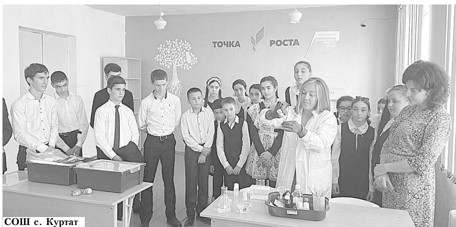
СОШ с. Куртат

Начало учебного года в районе выдалось богатым на события. После капитального ремонта открылись четыре школы, а следом – в шести образовательных учреждениях – "Точки роста": в СОШ №1 с. Октябрьского, СОШ №1 и №2 с. Тарского, СОШ №4 с. Чермен, СОШ с. Куртат и СОШ с. Комарон. Центры технической и гуманитарной направленности помогают детям развивать свои знания и приобретать новые.