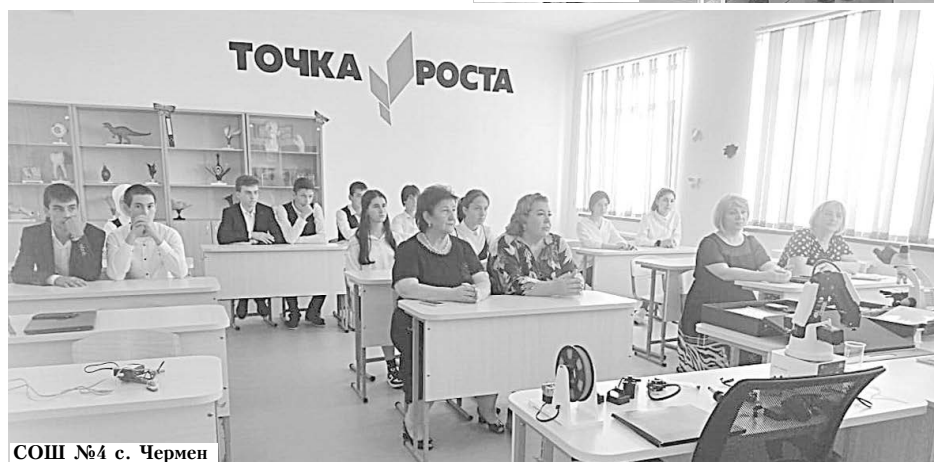
СОШ №4 с. Чермен