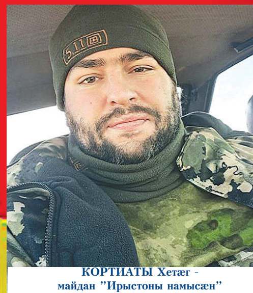
КОРТИАТЫ Хетæг - майдан "Ирыстоны намусæн"