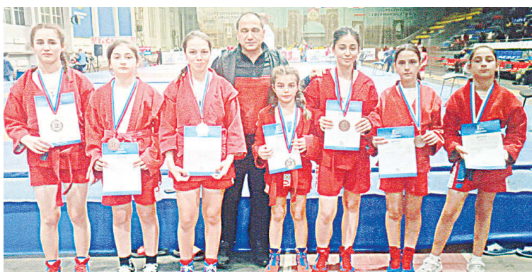
Победители и призеры первенства республики по самбо со своим тренером

Во дворце "Манеж" (г. Владикавказ) прошло открытое первенство РСО – Алания по борьбе самбо, приуроченное к 85-летию образования этого вида спорта. В нем приняли участие представители Южной Осетии, Кабардино-Балкарской, Карачаево-Черкесской, Дагестанской и Чеченской Республик, РСО – Алания и Ставропольского края.