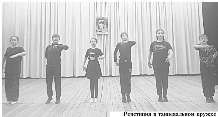
Репетиция в танцевальном кружке