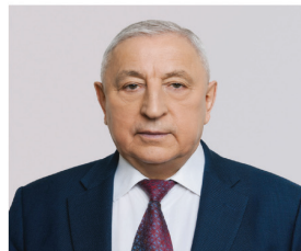
ХАРИТОНОВ НИКОЛАЙ МИХАЙЛОВИЧ

1948 года рождения; место жительства – город Москва; Государственная Дума Федерального Собрания Российской Федерации, депутат, председатель Комитета Государственной Думы по развитию Дальнего Востока и Арктики; выдвинут политической партией «Политическая партия «КОММУНИСТИЧЕСКАЯ ПАРТИЯ РОССИЙСКОЙ ФЕДЕРАЦИИ»»; член политической партии «Политическая партия «КОММУНИСТИЧЕСКАЯ ПАРТИЯ РОССИЙСКОЙ ФЕДЕРАЦИИ»», член Центрального Комитета партии, член Президиума Центрального Комитета партии