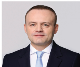
ДАВАНКОВ ВЛАДИСЛАВ АНДРЕЕВИЧ

1984 года рождения; место жительства – город Москва; Государственная Дума Федерального Собрания Российской Федерации, депутат, заместитель Председателя Государственной Думы, член Комитета Государственной Думы по бюджету и налогам; выдвинут политической партией «Политическая партия «НОВЫЕ ЛЮДИ»»; член политической партии «Политическая партия «НОВЫЕ ЛЮДИ»», член Центрального совета партии