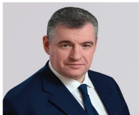
СЛУЦКИЙ ЛЕОНИД ЭДУАРДОВИЧ

1968 года рождения; место жительства – город Москва; Государственная Дума Федерального Собрания Российской Федерации, депутат, руководитель фракции Политической партии ЛДПР – Либерально-демократической партии России, председатель Комитета Государственной Думы по международным делам; выдвинут политической партией «Политическая партия ЛДПР – Либерально-демократическая партия России»; член политической партии «Политическая партия ЛДПР – Либерально-демократическая партия России», Руководитель Высшего Совета партии, Председатель партии