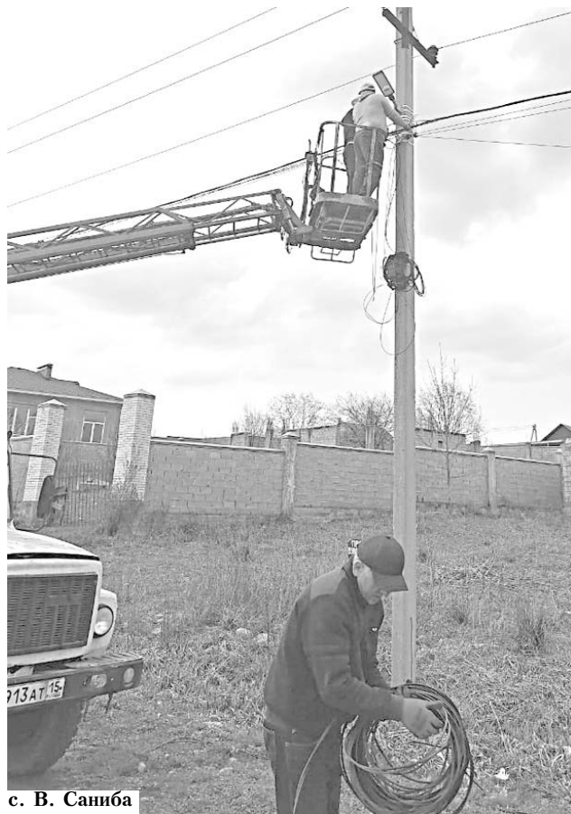
с. В. Саниба