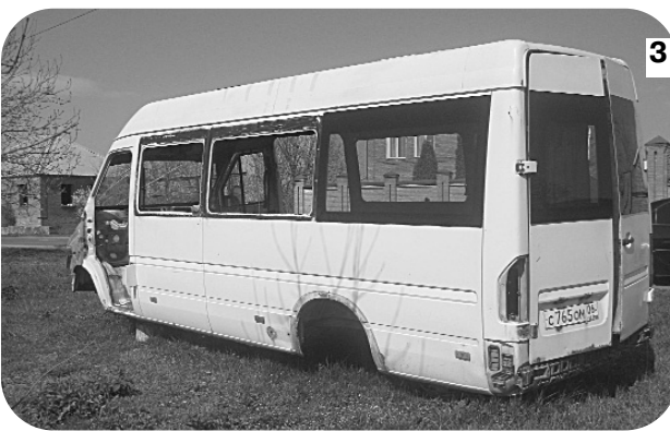
3 Федтам Куырттаты æмæ Дачнæйы хъæутæ дæр. Уымыты дæр у сыгъдæг, хицæн чысыл хъуыддæгтыл куы нæ дзурæм, уæд. Фæлæ Дачнæйы хъæуы цæрæн корпусы цур калд уыд бирæ бырæттæ (цыппæрæм къамы). Хъæуы бынæттон

Дæрддтыл у Камбилевкæйы хъæу . Ис дзы фæрсырдæм æмæ дæргъæй-дæргъмæ дæр бирæ уынгтæ. Ацыдыстæм съл æмæ та ам дæр - сыгъдæг, æфснайд. Бынæттон администраци, скъолатæ, адæм хорз бакуыстой уæлмæрдтæ ныссыгъдæг кæныныл, йæ быру йын хуызджын ахорæнтæй сахуырстой. Хъæубæстæ сæ хъус хорз дарынц сæ хиуæтты ингæнтæм. Æрмæст раст нæу, хъæуы сæйраг уынды фæндаджы был хæлд техникæ кæй лæзæры (æртыккаг къамы) бирæ рæстæг, уый.