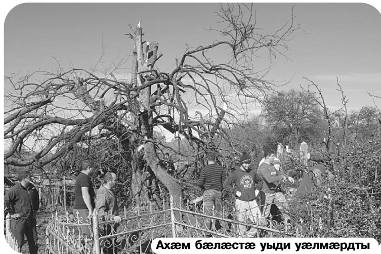
Ахæм бæлæстæ уыди уæлмæрдты