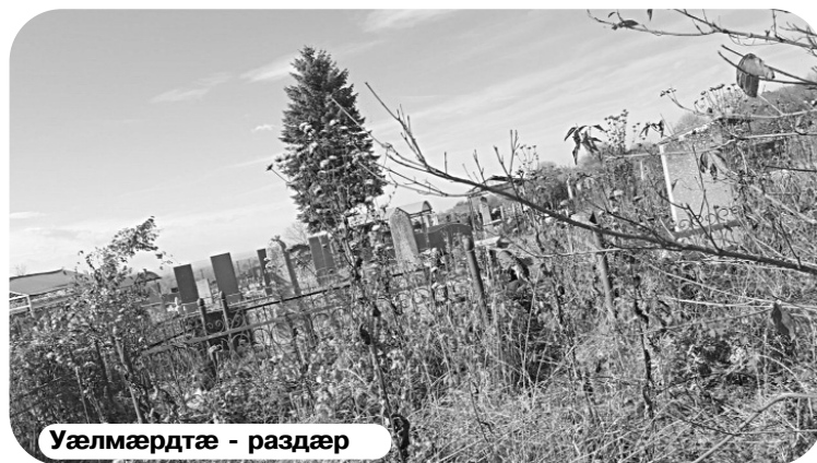
Уæлмæрдтæ - раздæр

Хъæуы аивдзинадмæ гæсгæ аргъ кæнынц цæрджытæн. Сунжæйæ Комгæронмæ цæугæйæ, цæст цы быдыртыл æххæссы, уыдон бырон æмæ хæмпæлгæрдæджы бын фесты, кæд æмæ раздæр та сæ уындæй зæрдæ ради.