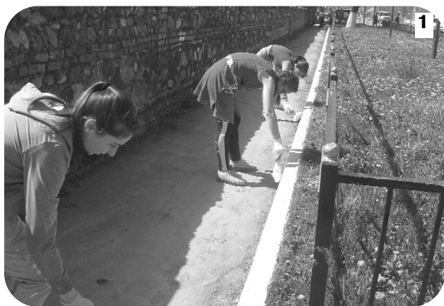
1 Рагæй нырмæ дæр сыгъдæгдзинад æнæниздзинады хос хонынц. Æмæ уый раст у. Фыдæлтæй нын баззæд: сыгъдæг хъуамæ уæм нæ хæдзæртты, кусæндæтты, улæфæн бынæтты, уынгты...

Фæстаг рæстæг нæ районы фылдæр хъусдард цауы хъæуты санитарон уавæрмæ. Уый тыххæй бынæттон администрацитæ афæдзы дæргъы цалдæр хатты саразынц зиуы бонтæ.