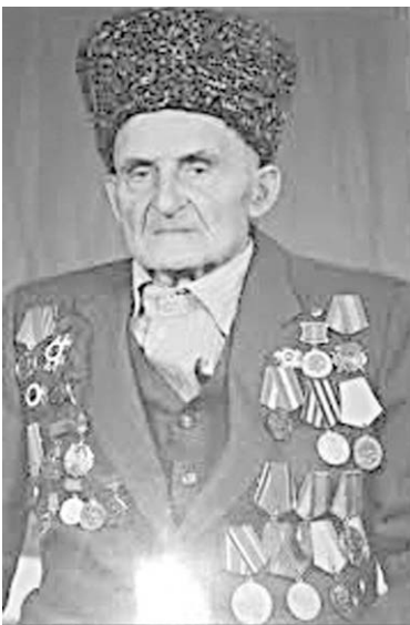
Кузьма кадджын адæймагыл.

Миха сыгдæгзæрдæ адæймаг уыд, æнæхынц, уарзта адæммæ цæрын, æмæ йын хæубæстæ дæр аргъ кодтой, ныматдой йæ