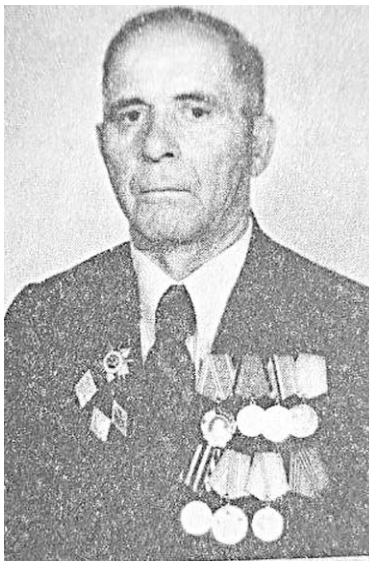
Михал дысты Цæгат Ирыстонмæ æмæ уайтагъд куыстыл нылæууыдысты.

1942 азы Миха ацыд хæстмæ æмæ 1944 азмæ тох кодта Хуссар фронты. Уæззау цæф фæцис знаджы нæмыгæй æмæ бахауд госпитальмæ. Куы фæдзæбæх, уæд хæцынæн нал сбæззыд, инвалидæй æрыздæхт Ирыстонмæ. Куы фæсæрæн, уæд райдыдта кусын, фылдæр фæллой фæкодта нæ районы хæды хæдзарæды. Хорзæхгонд уыд Сырх Стæллыы орденæй, Ленины орденæй, Фыдыбæстæйы хæ-